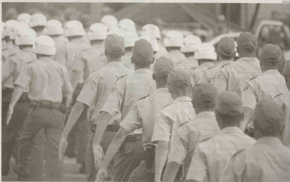
Os homens devem ter altura mínima de 1,65 metro, cinco centímetros a mais do que o exigido para as mulheres. Remuneração é de 930,00

por meio das secretarias de Administração (Sead) e de Educação (Seduc), irá contratar 3 mil professores. As vagas são para profissionais de Educação Básica Substituto I e professor de Educação Básica Substituto II. No total, são 500 chances efetivas (29 para deficientes) e 2.500 para cadastro reserva (129 para deficientes).